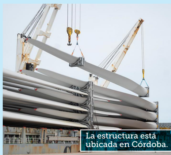
La estructura está ubicada en Córdoba.

A principios de 2024 se iniciará el montaje de las turbinas, que tomará aproximadamente 6 meses de trabajo y luego comenzará la fase de configuración, pruebas y puesta en funcionamiento. 📍