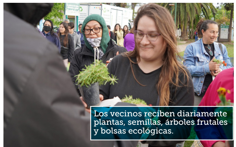
Los vecinos reciben diariamente plantas, semillas, árboles frutales y bolsas ecológicas.