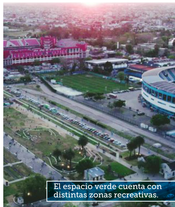
El espacio verde cuenta con distintas zonas recreativas.

La fecha de apertura de la licitación será el 29 de noviembre, y para consultas y adquisición de los pliegos los interesados podrán consultar en www.mda.gob.ar o dirigirse a la Jefatura de Compras y Suministros de Avellaneda, ubicada en Güemes 835 2° piso, de 8 a 14.