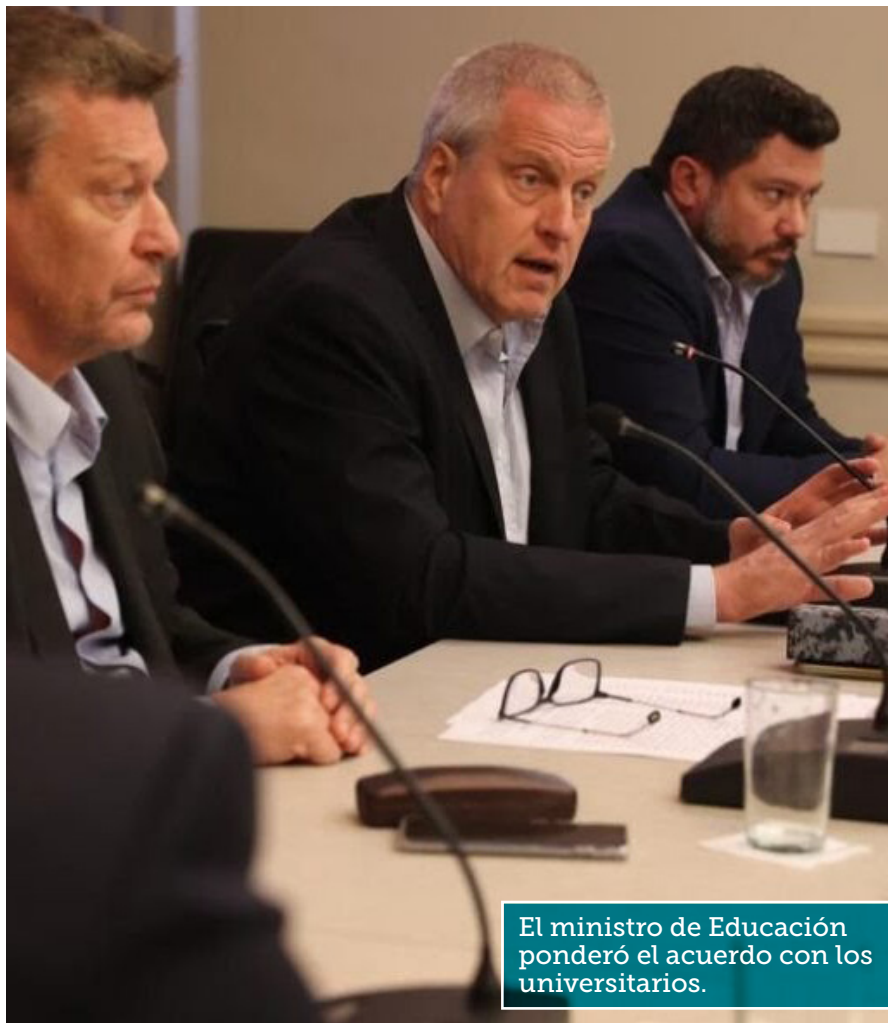
El ministro de Educación ponderó el acuerdo con los universitarios.

Se selló un incremento del 9 por ciento en noviembre, algo que fue aceptado por los gremios CONADU, FAGDUT, FEDUN, UDA y CTERA.