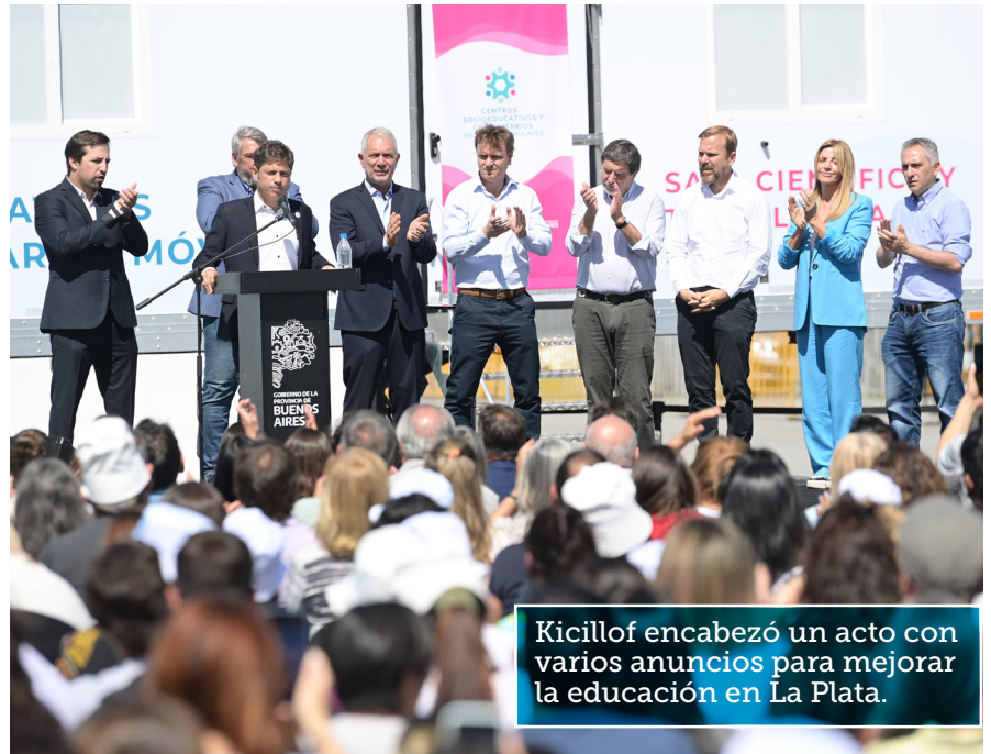
Kicillof encabezó un acto con varios anuncios para mejorar la educación en La Plata.

Los CSCM fortalecerán el trabajo pedagógico que llevan adelante los 191 Centros Socioeducativos y Comunitarios en Barrios Populares que ya se encuentran funcionando en 27 mu-