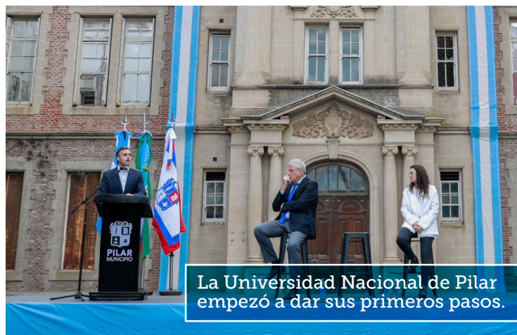
La Universidad Nacional de Pilar empezó a dar sus primeros pasos.

También con ofertas educativas no formales sostenidas sobre los pilares de la inclusión y la calidad, orientadas principalmente a las ciencias vinculadas a la tecnología, la