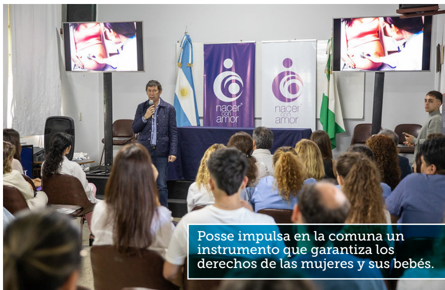
Posse impulsa en la comuna un instrumento que garantiza los derechos de las mujeres y sus bebés.

El intendente Posse encabezó la presentación junto a profesionales de la salud y vecinas en donde se presentó una guía con buenas prácticas obstétricas orientada en la atención integral del embarazo, parto y nacimiento.