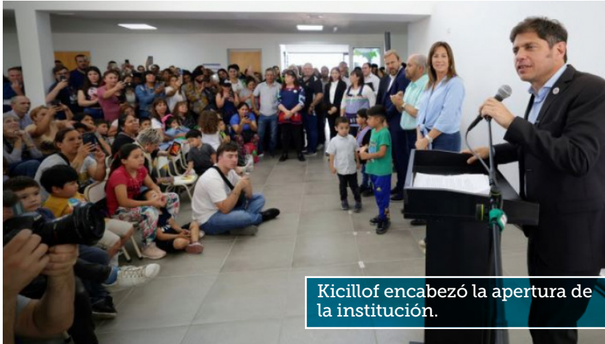
Kicillof encabezó la apertura de la institución.

La habilitación contó con la participación del gobernador bonaerense, Axel Kicillof, y el intendente local, Alejandro Granados.