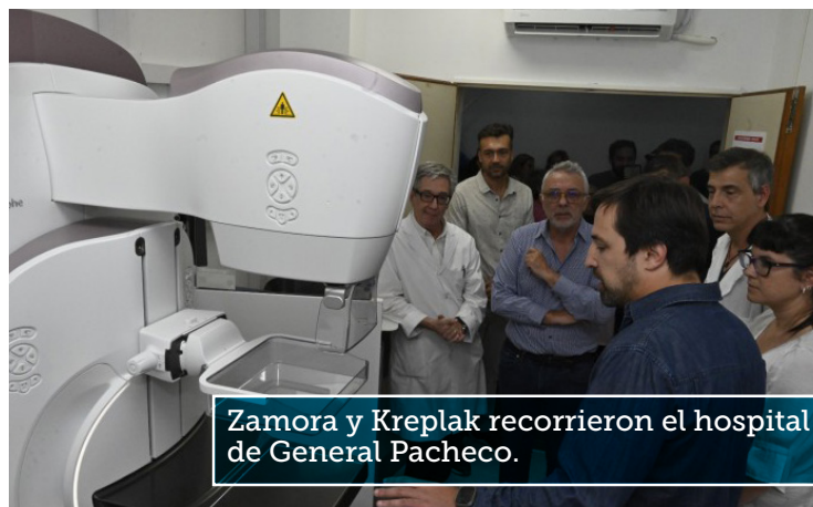
Zamora y Kreplak recorrieron el hospital de General Pacheco.

Y agregó: “La salud es una herramienta fundamental, sobre todo la labor en prevención que se brindan desde los 23 centros de salud locales, el trabajo que se realiza en este hospital y los HDI. Recibir estas herramientas posibilita