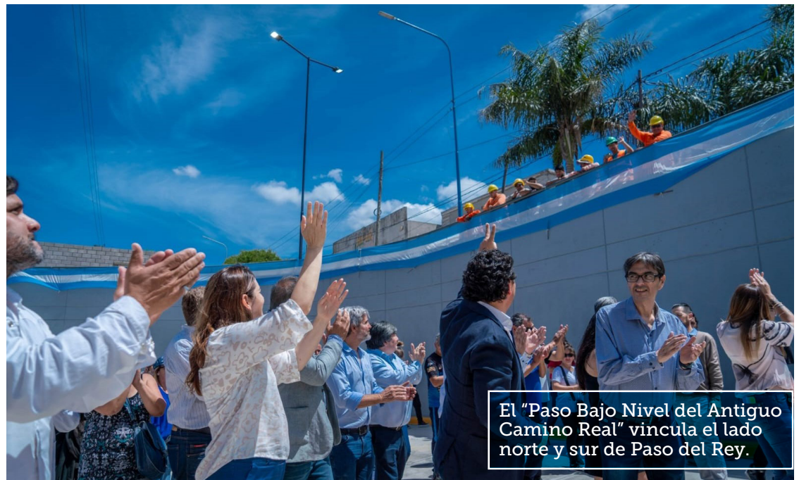
El “Paso Bajo Nivel del Antiguo Camino Real” vincula el lado norte y sur de Paso del Rey.

El “Paso Bajo Nivel del Antiguo Camino Real” se construyó sobre las calles Lebensohn y La Industrial, por debajo de las vías del Ferrocarril Sarmiento ramal Moreno-Once. Permite vincular el lado norte y sur de Paso del Rey y ga-