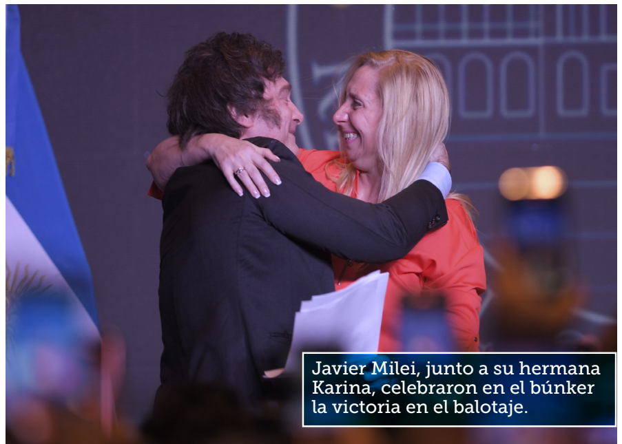
Javier Milei, junto a su hermana Karina, celebraron en el búnker la victoria en el balotaje.

La lista de reconocimientos se completó con menciones a los