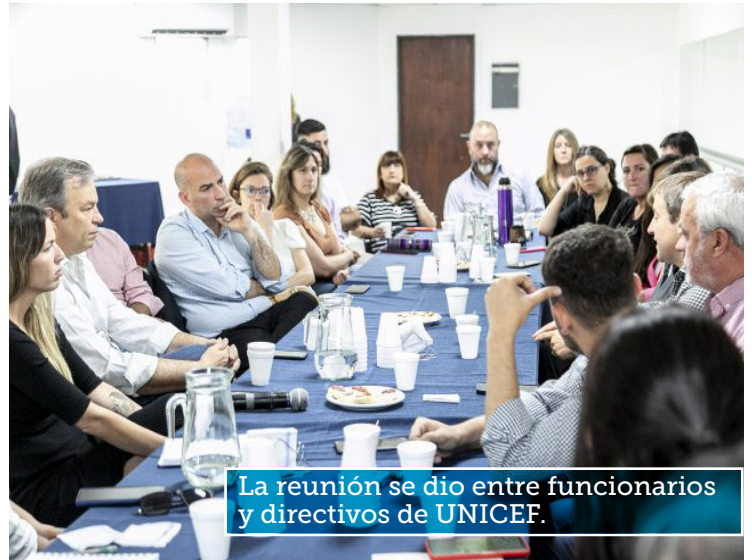
La reunión se dio entre funcionarios y directivos de UNICEF.

“Para nosotros es muy importante avanzar con esta iniciativa de UNICEF para contribuir en la consolidación del sistema de protección de niños, niñas y adolescentes en Almi-