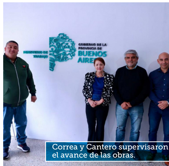
Correa y Cantero supervisaron el avance de las obras.

Y agregó: “Es un orgullo poder tener nuestra propia casa para poder atender nuestros propios problemas, siguiendo la política de nuestro Gobernador Axel Kicillof de llevar soluciones claras a nuestros vecinos y vecinas”.