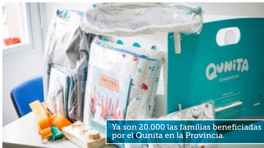
Ya son 20.000 las familias beneficiadas por el Qunita en la Provincia.

“Es un día con mucho amor al recibir también la esperanza de un pueblo que viene acá, que nos viene a buscar cuando más nos necesita”, sostuvo el ministro de Salud de la Provincia, Nicolás Kreplak.