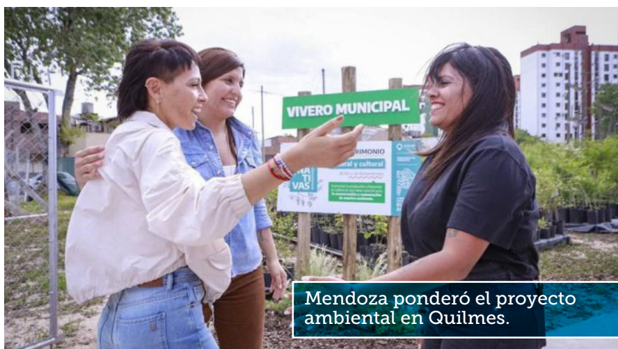
Mendoza ponderó el proyecto ambiental en Quilmes.

Se trata de una iniciativa destinada a la juventud para crear redes comunitarias, algo ponderado por la intendenta de Quilmes y la ministra de Ambiente de la Provincia.