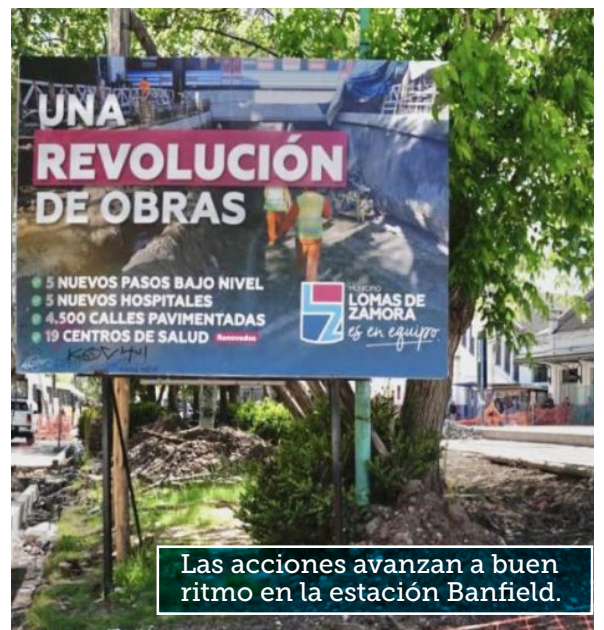
Las acciones avanzan a buen ritmo en la estación Banfield.

Además, la obra incluye espacios y circuitos especiales para el funcionamiento del sistema de taxis y la renovación del edificio de la estación mediante la reformulación de los espacios circundantes y la puesta en valor de su fachada y accesos. Por último, se efectuará la revalorización y jerarquización de la Ermita religiosa, así como de los monumentos y placas de conmemoración y homenaje existentes.