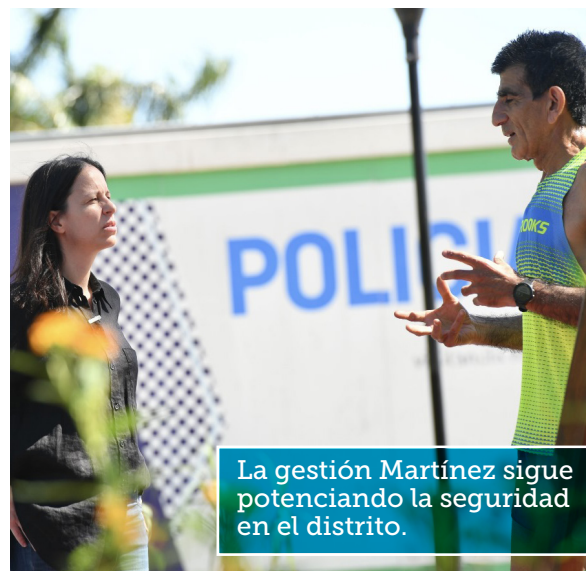
La gestión Martínez sigue potenciando la seguridad en el distrito.

“Y nuestra presencia con patrullas y motos en cada rincón del distrito. En Vicente López la seguridad es la principal prioridad de nuestro gobierno y lo va a ser los próximos años”, abundó.